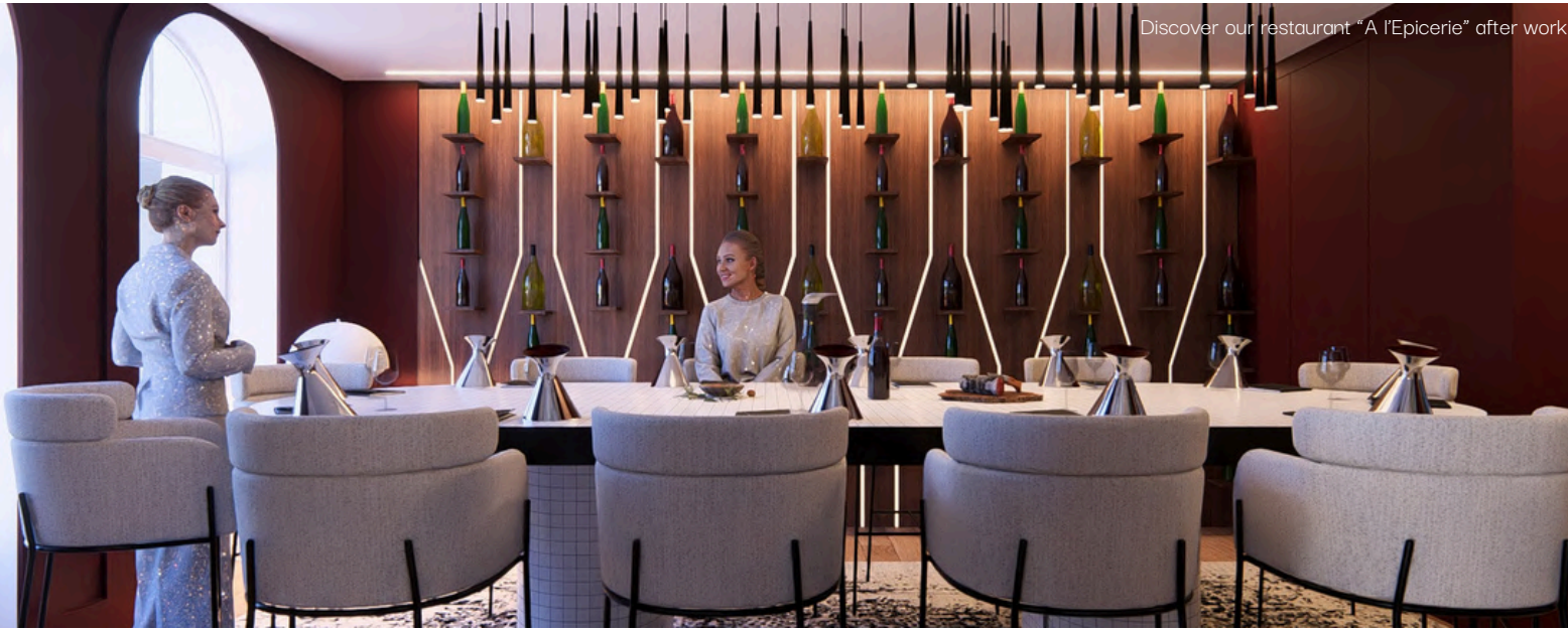
Discover our restaurant "A l'Epicerie" after work