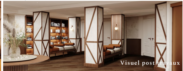
Visuel post travaux