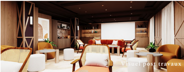
Visuel post travaux