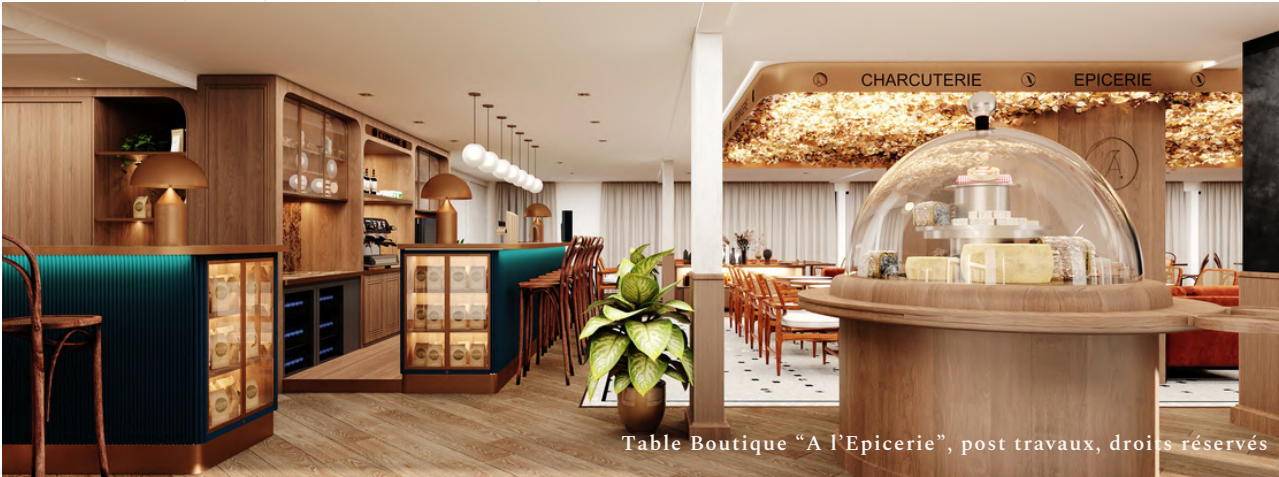
Table Boutique "A l'Epicerie", post travaux, droits réservés